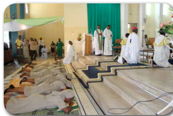
Cattedrale Regina Mundi Bujunbura - Burundi Professioni perpetue 16 Luglio 2011

Trimestrale di informazione missionaria dell'Istituto Suore di santa Dorotea di Cemmo ramo Onlus Dir. Resp.: Cecilia Bertolazzi - Aut. Trib Brescia n°1/2008 del 08.01.2008 Direz. Red e ritorni: Via Sant'Emiliano, 30 - 25127 Brescia - Stampa: Modulgrafica Caldera - Lumezzane (Bs) Poste Italiane Spa - Spedizione in Abbonamento Postale - D.L. 353/2003 (conv. In L. 27/02/2004 n. 46) art. 1, comma 2 - DCB Brescia